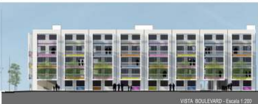
VISTA BOULEVARD - Escala 1:200