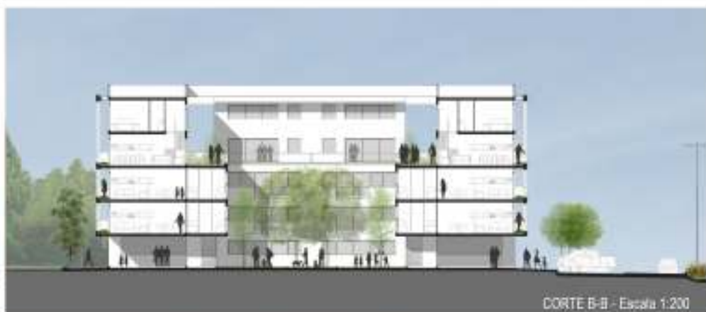
CORTE B-B - Escala 1:200