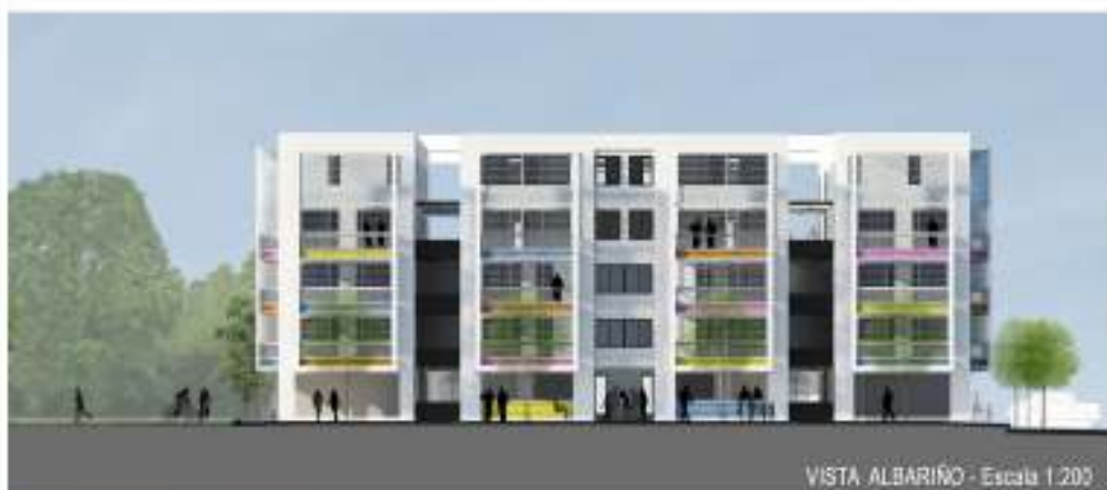
VISTA ALBARIÑO - Escala 1:200