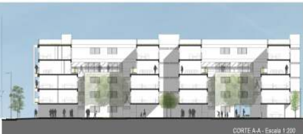
CORTE A-A - Escala 1:200