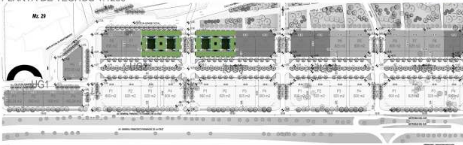
PLANTA DE TECHOS 1:1250