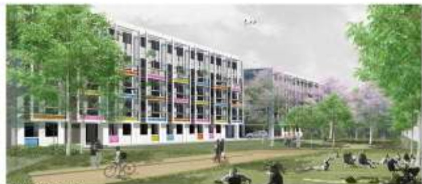
DESDE PARQUE LINEAL