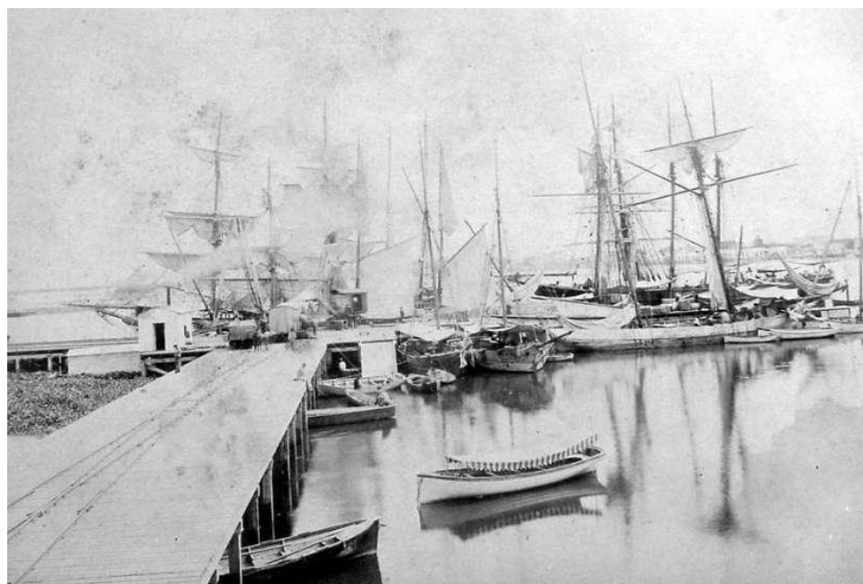
Gráfico 3: Puerto de Colastiné sur, Galpones y vías de Angel Casanello y Cía”. Año 1904.