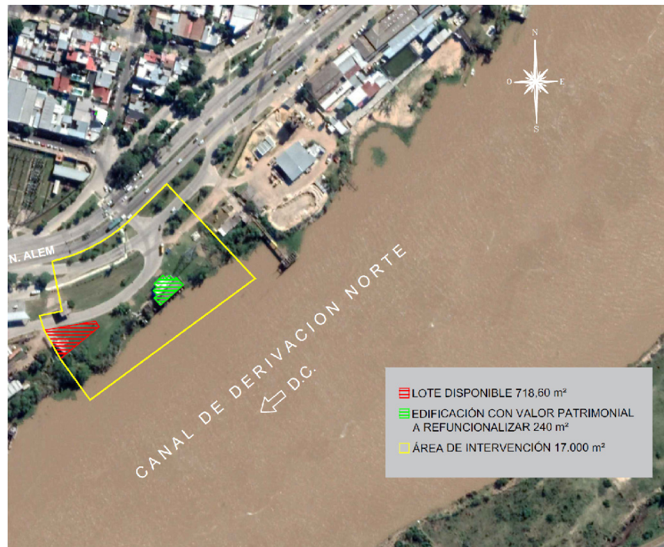
Gráfico 5: Área de intervención del Concurso Nacional de Ideas "Desarrollo arquitectónico, urbanísticos y paisajístico del acceso noreste del Distrito ciudad-puerto de Santa Fe"